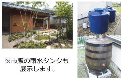
※市販の雨水タンクも展示します。